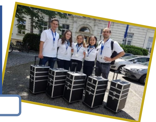
Unsere Coaches an Ihrer Schule...