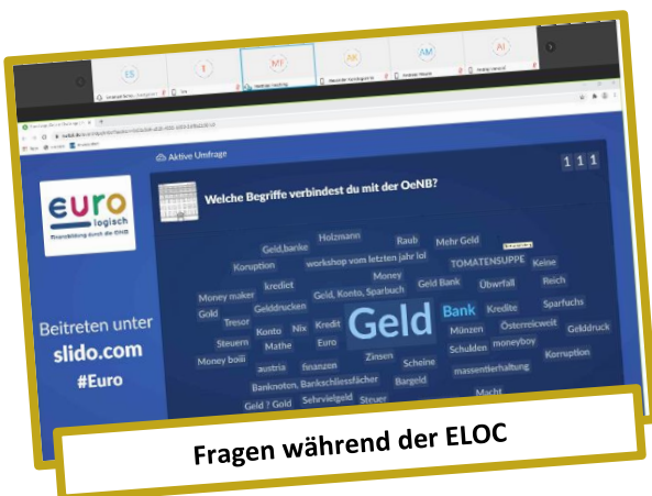
Fragen während der ELOC

Würden Sie die Euro-Logo- Online-Challenge erneut buchen oder weiterempfehlen? Ja auf alle Fälle! Das ist Zukunftsmusik! BG Tulln