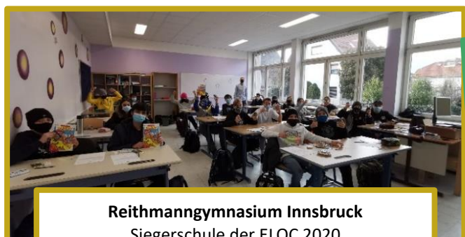
Reithmannsgymnasium Innsbruck Siegerschule der ELOC 2020 (von insgesamt 31 Schulen)

Vielen Dank für die Durchführung der Euro- Logo-Online-Challenge! Es war ein professionell gestalteter und interessanter Vormittag für alle teilnehmenden Schüler*innen. BRG Viktring